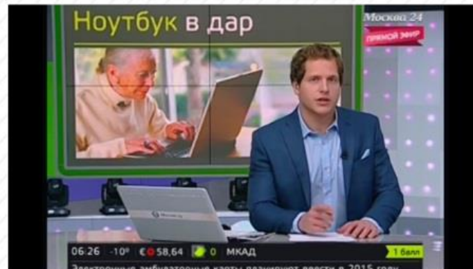
Москва 24 «Вечер»