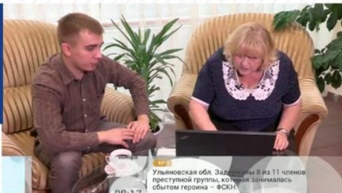
Первый канал «Доброе утро»