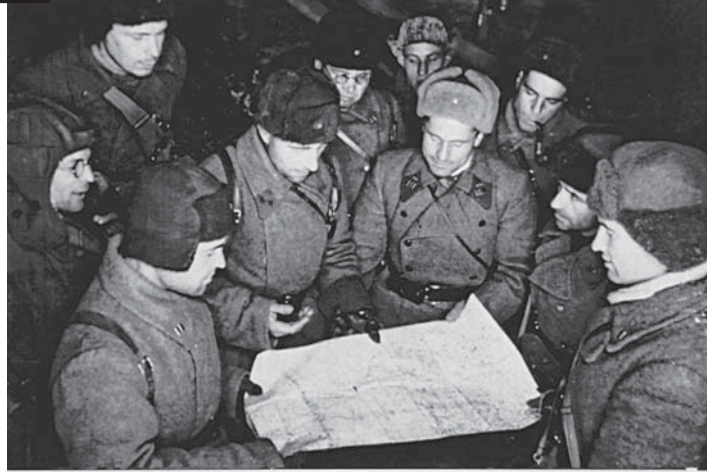
Генерал-майор Катуков Михаил Ефимович среди танкистов. Декабрь 1941 г.